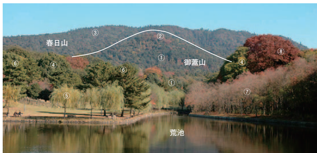
図2. 奈良公園，御蓋山および春日山原始林。①スギ，②落葉広葉樹，③照葉樹林，④常緑広葉樹，⑤ヤナギ，⑥マツ，⑦ナンキンハゼ，⑧ケヤキ（11月下旬）

若草山という名称は記されていないものの，南北度山峯の北側に位置する現在の若草山のあたりは，現在のような草地ではなく，森林と隆起が描かれている。神奈備としての御蓋山（春日大社境内）と春日山が地図の中心に描かれ，御蓋山の前方は「神地」と明記され，当時の人々の意識が表れている。神地と記されている部分は春日大社境内地で，現在，ナギ群落が成立しているあたりである。当時，どの程度の大きさのナギが猷木されたのか不明であるが，春日大社学芸員の松浦氏によると，春日大社の宮司日誌には1400年あたりから，ナギの樹木が大きくなったという記述がでてくるとのことであった。現在，春日大社境内の御蓋山のナギ群落は純群落に近い組成をもち，天然記念物に指定されている。