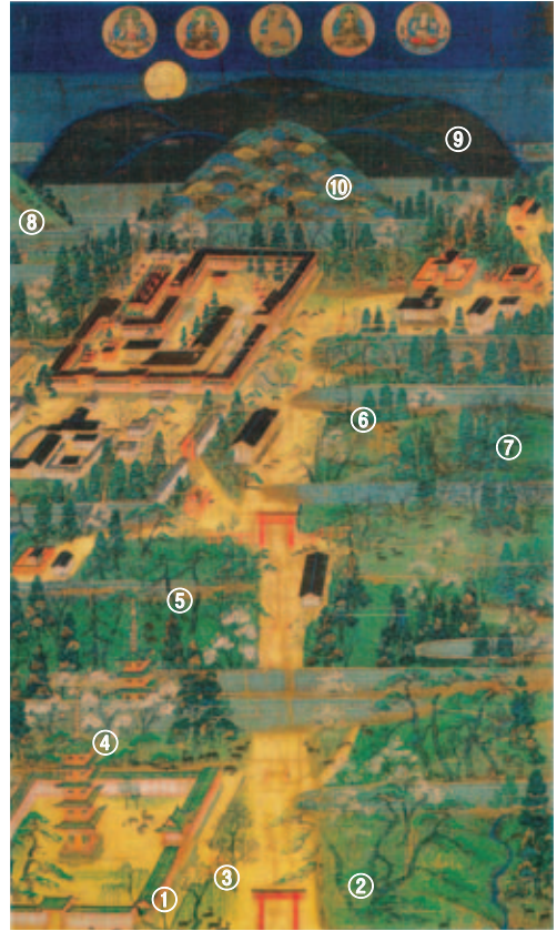
図9. 春日社寺曼荼羅（南北朝時代，根津美術館）. 一の鳥居（現在の一の鳥居は本図の位置よりさらに上方）. 興福寺五重の塔（手前）から，東に位置する春日山までが描かれている。①ヤナギ，②向影のマツ，③サカキ（解説による），④サクラ，⑤マツ，⑥スギ，⑦広葉樹，⑧若草山，⑨春日山，⑩御蓋山。（画像掲載について根津美術館の許諾済）

春日社寺曼荼羅の解説（根津美術館，2011）によると，一の鳥居付近の樹木はサカキとある。参道には枝分かれしたりっばな ようこう 影向の松が描かれている。一の鳥居から二の鳥居，