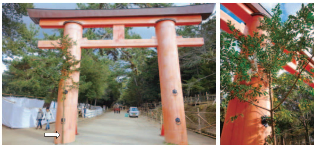
図7. 一の鳥居からみた参道のマツ林景観。矢印はナギ（左）。12月17日の若宮おん祭に際して、鳥居につけられたナギ（右）。2014年12月19日撮影