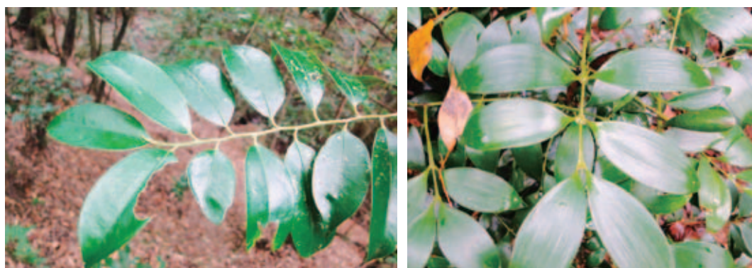
図5. 御蓋山のサカキ (左) とナギ (右). 前者の葉は互生, 長楕円形. 腋芽は少ない. 葉柄は5mm程度. 後者は対生, 楕円状披針形から卵状楕円形で葉の基部に腋芽が付いている. 葉柄は2mm程度で目立たない.

始林にも広がっている (Maesako et al., 2007)。シカは草本植物だけでなく、樹木の枝葉を採食するが、ナギは採食されないことや暖温帯の気候条件が生育に適していたため、長い時間をかけてナギ群落 (図4) が形成されたと考えられる。