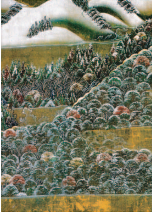
図8. 春日権現験記繪 第十九卷（鎌倉時代，宮内庁）. 常緑広葉樹，落葉広葉樹および針葉樹からなる春日山が描かれている。（画像掲載について根津美術館の許諾済）