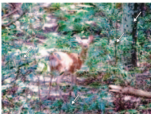
図4. 御蓋山のナギ群落 (天然記念物). ナギの成木から稚樹および実生までのナギ (矢印) が生育する. 林内にはナギのほかに, イヌガシ, イワヒメワラビ, ナチシダ, 日本固有種カミガモシダなど, シカに採食されない植物が生育する.