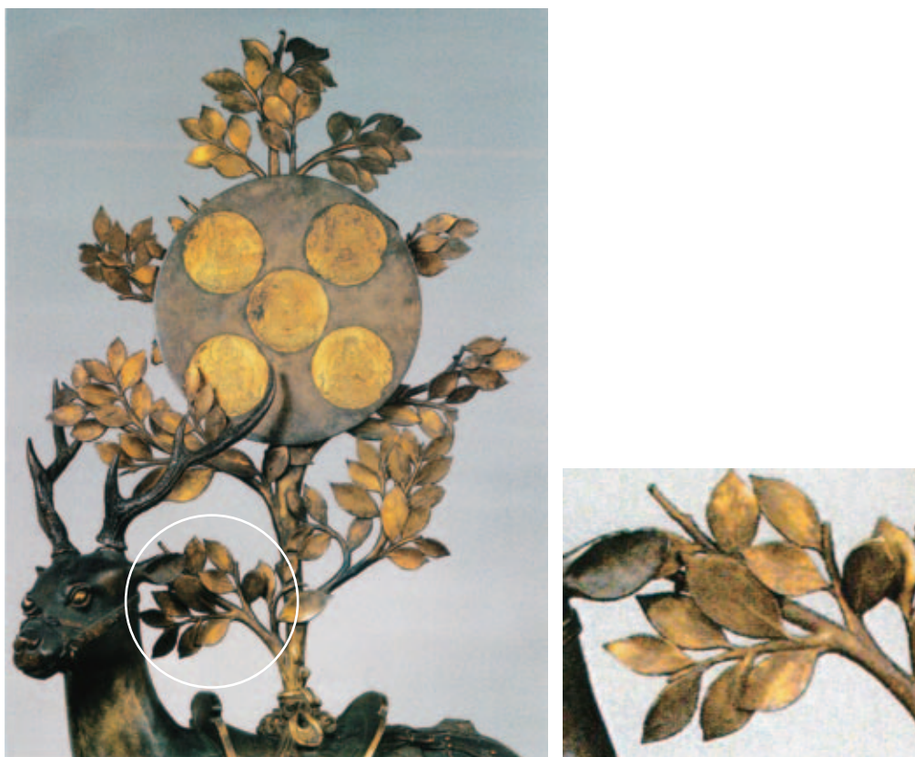
図6. 春日神鹿御正体（鎌倉時代から十四世紀）。神鹿の背に榊を立て、神鏡を掲げている。植物はサカキとされるが、ナギによく似ている。（右）円内の拡大。