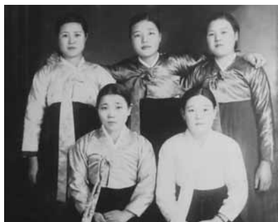
図6 大池橋に住んでいた時の友人たちと